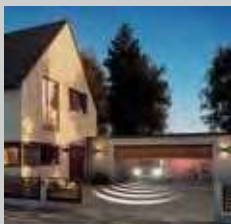
Garagen- und Einfahrt-Antriebe Mit Garagen- und Einfahrt-Antrieben für alle Garagentypen und Einfahrtstypen

Of u bedient uw deur met vaststaande bedieningselementen, zoals bijvoorbeeld een radiocodeschakelaar of draadloze vingerscanner.